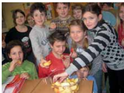
Mit Appetit verspeisen die Kinder die Apfelstücke, die an verschiedenen Tagen ausgegeben werden.

Einmal in der Woche werden auf Gemeindegeldkosten frische Äpfel geliefert.