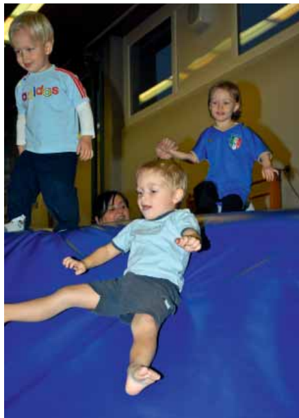
... das macht Spaß

Ein von Anfang bis zum Ende interessantes, abwechslungsreiches ein- und zweistündiges Programm mit tollen Leistungen in jeder Sparte und Altersgruppe.