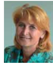
Vizebürgermeisterin Renate Kapl, Obfrau des Umweltausschusses