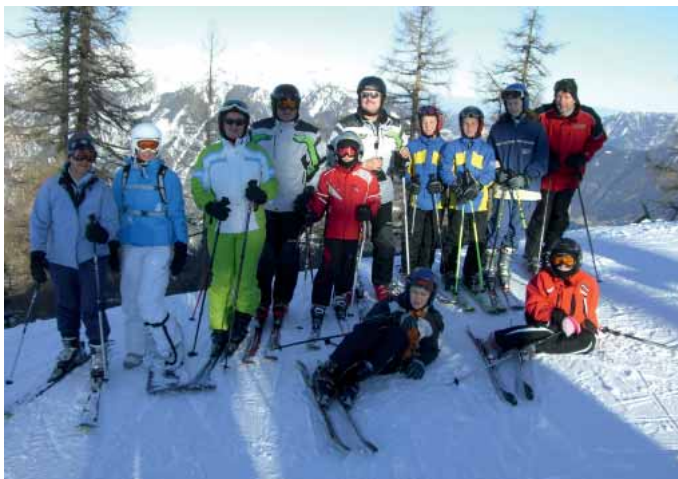
Kinderschitage in den Weihnachtsferien

Wir gratulieren herzlich zu diesen ausgezeichneten Leistungen.