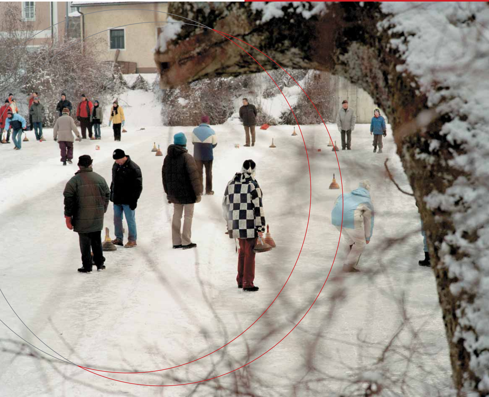
Eisstockschißen auf dem Bräuhausteich

Im Blattinneren finden Sie den ersten Teil des Auswertungsergebnisses der Bürgerbefragung 2008.