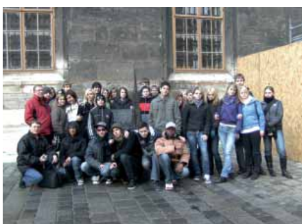
Bildungsreise nach Wien