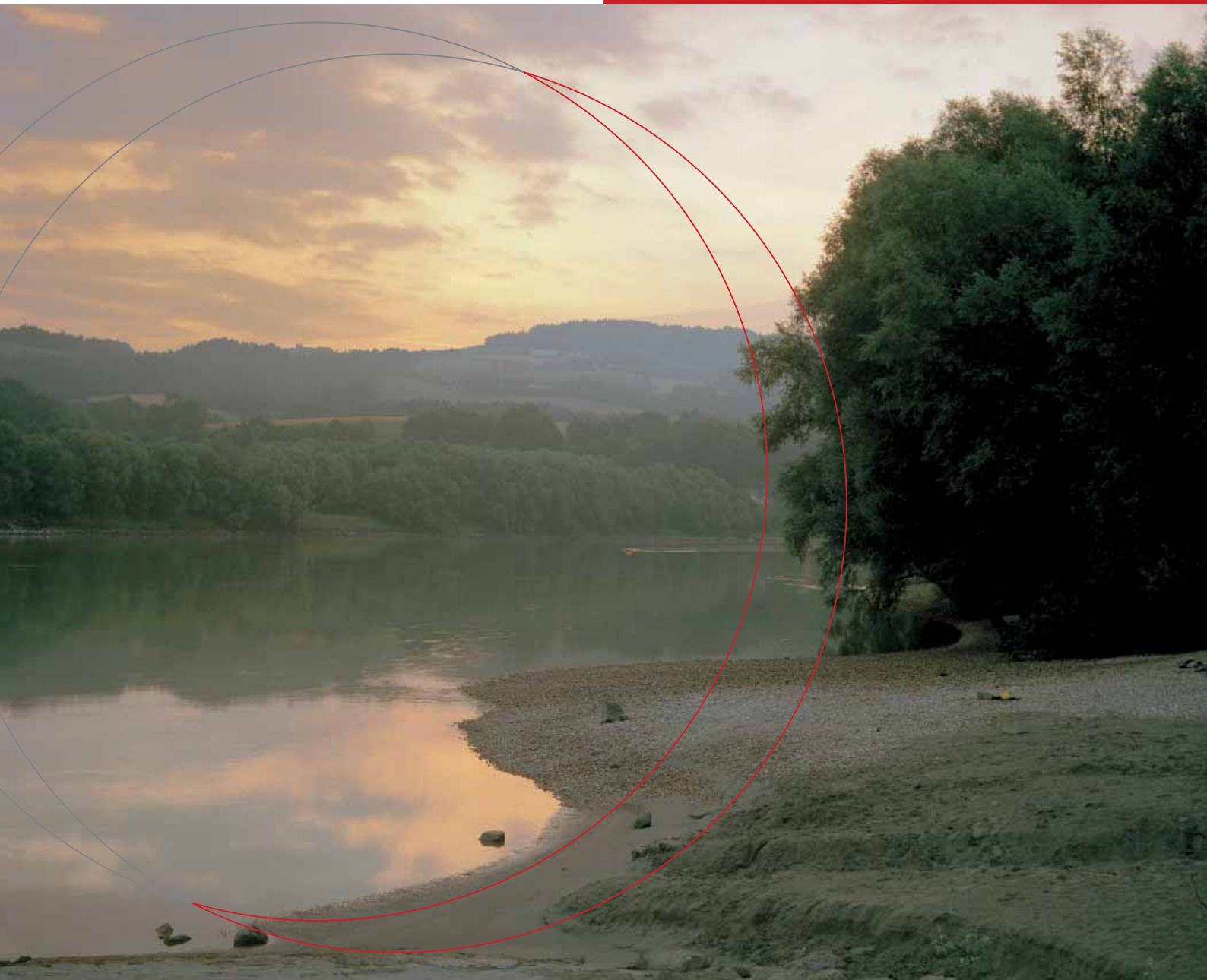
Sonnenaufgang bei der Donau in Ufer