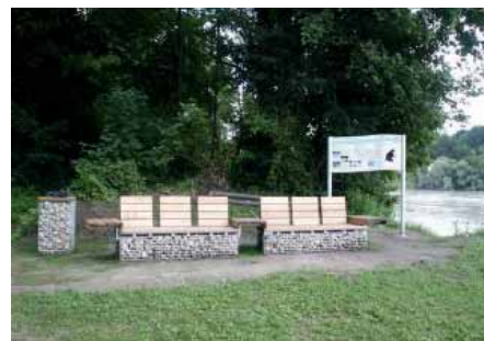
Rastplatz Stift Wilhering