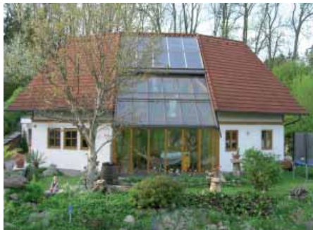
1. Platz Fam. Langthaler jun. Hersteller Fa. Solarteam

Allen weiteren Teilnehmern danken wir nochmals für ihr Engagement, sich an diesem Fotowettbewerb zu beteiligen und ganz besonders für die Nutzung der Sonnenenergie.