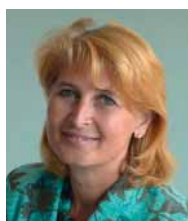
Vizebürgermeisterin Renate Kapl