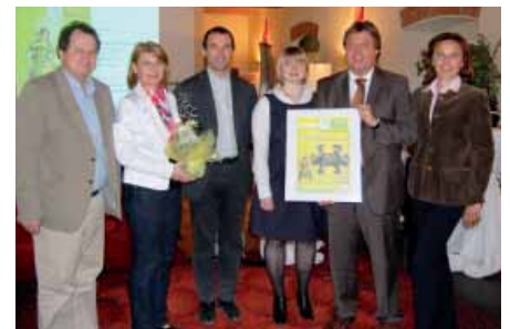
Die GemeindevertreterInnen der Leader-Region Linz-Land erhielten Bilder mit Puzzleteilen ihrer Gemeinde als Symbol für die regionale Bedeutung der Landesgartenschau 2011 in Ansfelden.