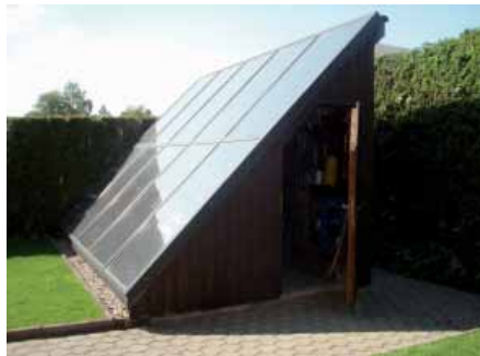
2. Platz Heinrich Woidl Fabrikat: MEA